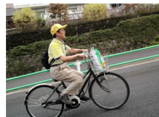
電動付きなので急な坂道でも立ちこぎなくて大丈夫