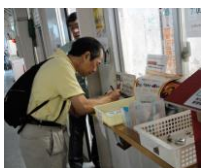
身分証明と500円が必要