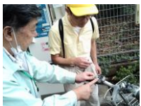
24時間以内ならいつ返してもOK