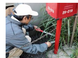
切れ味 悪くないです