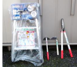
シマホで安く買えました