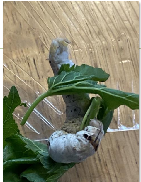
むしやむしやかいこ

近代の日本を支えた製糸産業の基である養蚕を研究する蚕糸試験場が、1980年に筑波に移転した跡地に、蚕糸の森はつくられました。地域の人々の憩いの場であると同時に、災害時には、様々な防災機能を備えた広域避難場所になります。