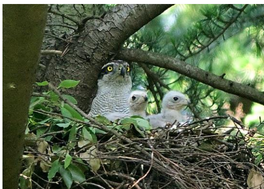
7月にはたくましく成長したヒナ